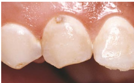
Cariesangrebet har her udviklet sig til et hul i tanden

Fortsætter mineraltabet, vil tanden før eller siden bryde sammen, og fysisk vil der komme et hul i tanden.