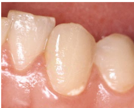
Et begyndende cariesangreb ses som et hvidligt område på tanden

I begyndelsen kan man ikke se caries med det blotte øje. Hvidlige forandringer på tanden er ofte det første synlige tegn på caries. Det er udtryk for, at syre er ved at opløse tandens mineral.