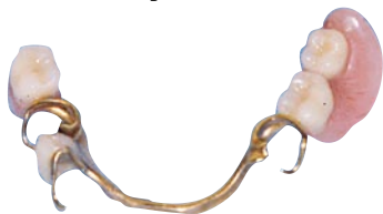
Protesetænder på støbt stel.

En langt bedre form for delprotese er den med et støbt stel, kaldet en unitor. Her er bøjlerne og en eventuel ganeplyade fremstillet i støbt metal (som regel en blanding af krom og kobolt). Dette er hårdt metal med stor styrke. Det betyder, at man kan bruge metallet i ganske tynde lag og alligevel opnå, at protesen bliver tilstrækkelig solid.