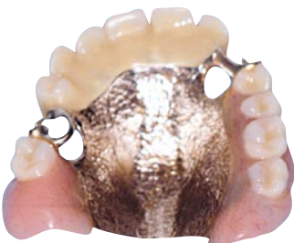
Delprotese med støbt stel til overmunden.

En delprotese med et støbt stel kan udformes, så den fylder mindre end en protese af akryl. Den bliver derfor nemmere at vænne sig til, og den ser som regel også pænere ud.