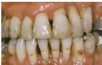
Samme tandsæt efter udtrækning af tænder.