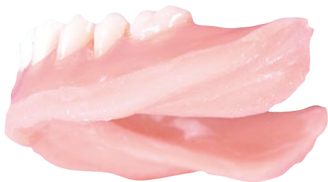
Protese med gummilag

Tandlægen kan i mange af disse tilfælde hjælpe ved at forsyne undersiden af protesen med et lag gummi. På den måde vil protesen opleves mere behagelig, fordi det elastiske gummilag fjedrer, når du bider eller tygger sammen med protesen. Gummilaget skal som regel udskiftes med jævne mellemrum.